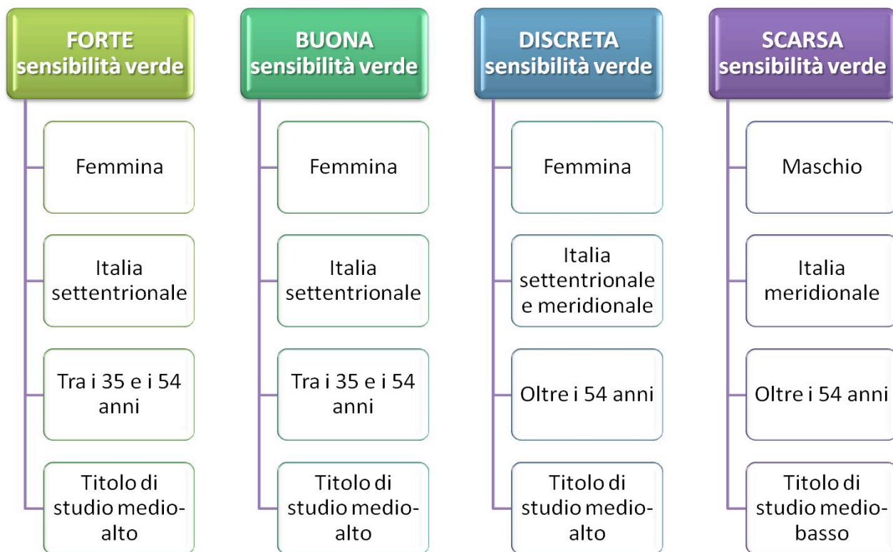
Tabella 1. Identikit del cittadino eco-sostenibile

Elaborazioni Fondazione Impresa su interviste PanelData